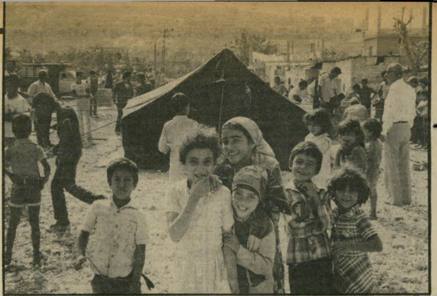
1 האוהל הראשון - ובניתיים גם האחרון - הוקם במרכזו של מחנה הפליטים עין-אל-חילוה, שליד העיר הלבנונית צידון. הפליטים הפלסטינים מקיפים את האוהל הקטן, וחלקם מתבוננים בהשתאות במיתרון שמציע להם השר הממונה על הסיוע לפליטים לתקופת החורף הקשה בלבנון.