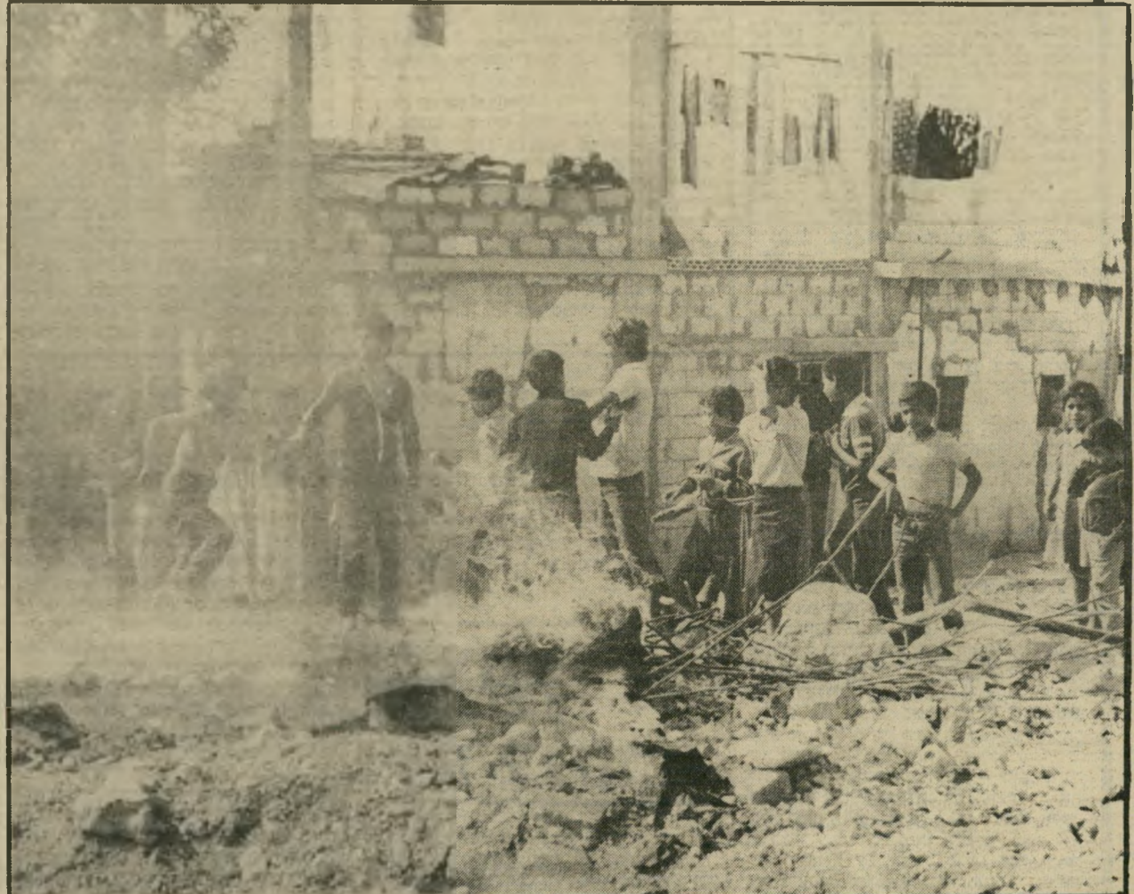
3 הנערים ביקשו שלא להשאיר מקום לספק. הם רצו להבהיר כי הם אינם סבורים שהאוהל יכול לשמש להם פיתרון לימי החורף הקרים, ועד מהרה נמצא מישהו ששילח אש בבד האוהל וביתדות העץ שלו, וזהו, בינתיים, סופו של נסיון השיקום הזה. בישראל לא הפריע הדבר לאנשי ציבור לטעון שהפלסטינים הם כפויי טובה.

7 ה-26 באוקטובר היה יום שמש נאה במחנה הפליטים הפלסטיני עין-אל-חילוה שליד צידון. למחנה הגיעה חבורה נכבדה, שלוחה במשאית. על המשאית היה אוהל בד וכל הצירוד הנחוץ לבנייתו: יתדות, מוטות ופטישים. הפליטים המתרגורים בקירבת מקום התאספו כדי לחוות במתרחש, וראו כיצד מקימים הפועלים את האוהל הכהה, במרכזו של רחבה קטנה.