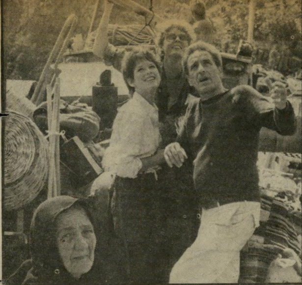
ריינגודר קאסאבטס ורודאנרם לחזור לניו יורק

מתחיל מתבטל לפני פרוספרו באוניברסיטה. סערה אינו סרט כזה. יש סרטים אחרים, אולי פחות חשובים, עמוקים ומושלמים, סרטים שלפי אמות המידה הקלאסיות מספקים פחות, סרטים שביקורת מסוימת עשויה לעקם אפה בעדינות איסטניסית על שאינם מחוכמים די הצורך, ואף-על-פי-כן, הם מסבים הנאה, ומקנים לצופה תחושה של התעלות ותענוג, נוג, שניתן למצוא אותה רק לעתים-רחוקות בסרטים מן הסוג הראשון. סערה שייך ל-קטגוריה הזאת.