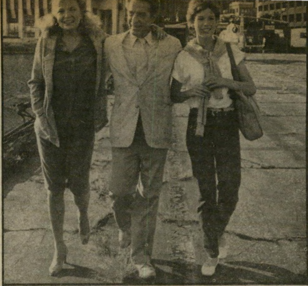
קאסאבטס, פאראנרוך וריינגוד לברוך ליוון

חיים אותם לאורך ולרוחב, מסבירים את מקורותיהם ותוהים על שרשיהם ובסופו של דבר, מתבטלים לפנייהם כמו שסטודנט