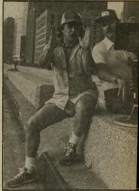
בימאי מאזורסקי בעבודה השראה מפרוספרו

יש סרטים גדולים - חשובים, עמוקים, סרטים שמעוררים התפעלות וקובעים אבן דרך בתולדות האמנות השביעית. מבקרי קולנוע קדים לפנייהם קידת עמוקות, מנהי