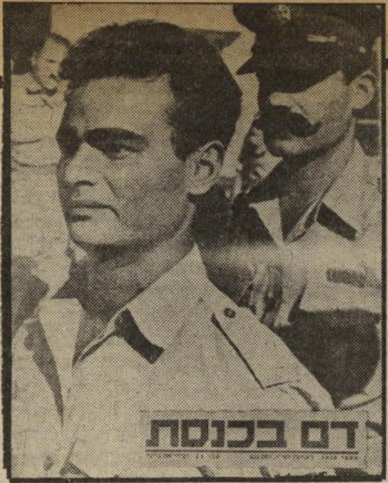
"העולם הזה" 1048 תאריך: 6.11.1957