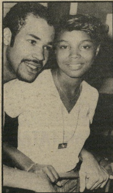
ארטה ודרל רובינפון אישית לוחצת

העיתונאית עמליה ארנמן-ברנע ידעה מכות קשות בחייה. עמליה, העובדת