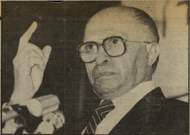
פרס מפחד מבגין

הקיום החוקי של מדינת ישראל בנבולות בטוחים ומוכרים. ● זכותו החוקית של העם ה-