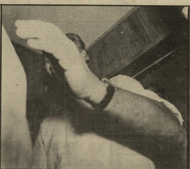
שריד מפחד מפרס