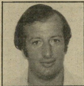
קורא גודרשטיין אל תידום לשונכם