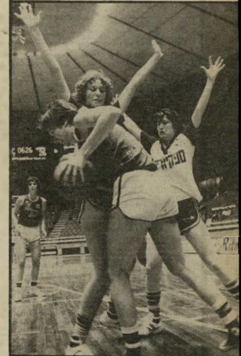
כדורסלניות ניבחרת ישראל לא עוד נשים נגד נשים

גם יריבו, המאמן דויד שוייצר, לא הסר-כים בקלות לפלישה לתוך הטריטוריה הי-פרטית שלו. אך אחרי הפצרות ושיכנועים, שזה יכול להיות נחמד ושצעות, קללות ו-ביקורת הן חלק-טיבעי של עולם הכדורגל — נאות המאמן עבה-כרס לאפשר לעין הי-