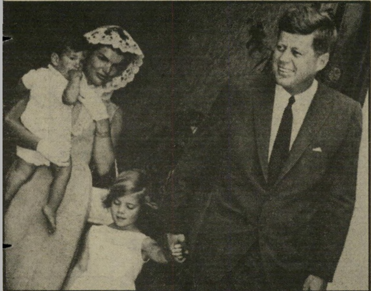
הנשיא קנדי (עם אשתו ובתו) מישראלית

השידור, בדבר הארכת החוזה של- הטלוויזיה הישראלית עם הבר-יבי- טי מגלה, כי במהלך שנת הטל- וויזיה הקרובה תקבל הטלוויזיה- הישראלית מידי הבר-יבי-טי 90- שעות שידור לשנה, לעומת 75- שעות בשנה החולפת.