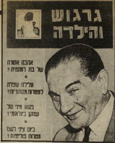
"העולם הזה" 1041 תאריך: 30.10.1957