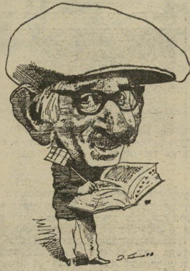
סופר מלמוד עם זכרות קשויה לזוגתו

* ברנרד מלמוד, פרקייחיים של דובין; עברית: אהרון אמיר; הוצאת עט'עובד; 444 עמודים (כריכה רכה).