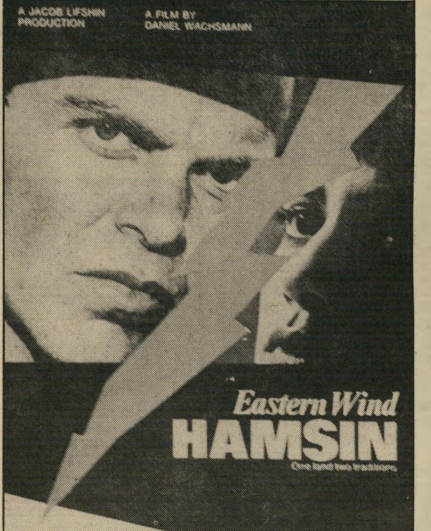
une CO-PRODUCTION LIBANO-TUNISO-BELGE PRODUCE FILMS ETABLISSEMENT ARAB DE PRODUCTION CINEMATOGRAPHIQUE: Retrouit S.A.C.P.C. - Tunis