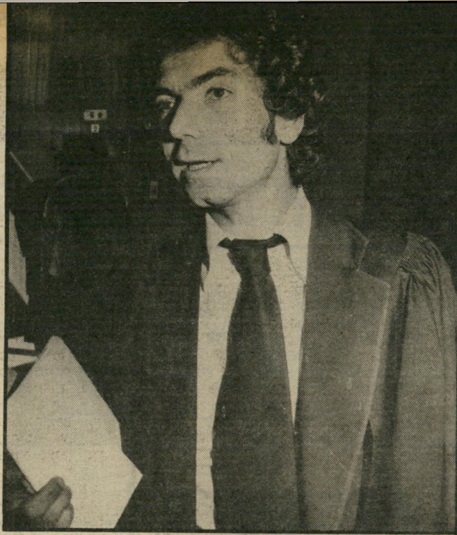
פרקדים כטיטו להתלונן