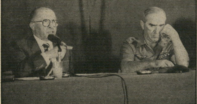
רמטכ"ל איתן וראשי-ממשלה בגין היק צאברה

ואם זו אינה הצהרה מוזרה, הצהרה מוזרה מהי שהרי מה חוקרת ועדת-החקירה? בוודאי שהיא מנסה לעמוד על האירועים עצמם. על-פי סידרם המדוייק.