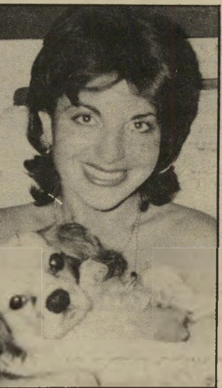
חובכת חיות שמיטוב לעצור את הזווטה

בזמנו פירמתם כתבות בנושא ההרעלות של עיריית תל-אביב, ור אני זוכרת שבאותה תקופה קם גוף שקרא לעצמו S.O.S. חיות, שהצהיר כי מטרתו המפורשת היא לעזור לחיות, לאסוף תולדים עווריים ולמצוא להם בתים. למטרה זו תרמנו מיספר ידידי דים ואני, בעין יפה וקיוונו שר בעית החיות המורעלות תיפתר בדרך זו.