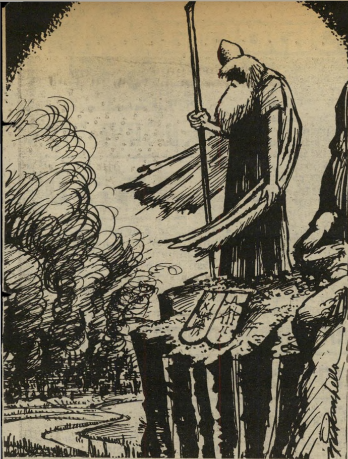
קריקטורה ב„דס-אנג'לס טיימס“ לוחות הברית נשברו בביירות

מפליאה הדרך שבה השוה מני-חם בגין את מילחמתו (האישית) בלבנון למילחמת העולם השנייה: