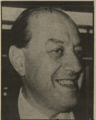
מיליארדור אייזנברג קונה מיועד

מרגע שהחלטת השרים לסגור את א"על הועברה להנהלה, התחילה זו לחפש