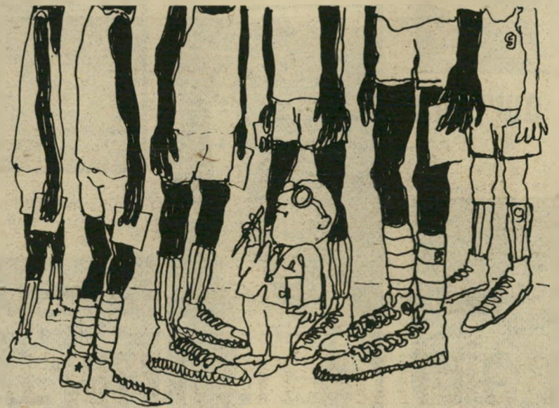
שחקן החיזוק הזר מס' 9 חוברת מחאה

הכדורסל הישראלי איבד כל פרופורציה מוסרית. כל תהליכי האזרחות המורוים והחחונות הפיקטיביות הם מעבר למה שמרשה העצמו גם הכדורסל האירופי. כי זה לא מסתיים פה עם שני אמריקאים וריס שמתר — כל השאר זה כאלה שהתגייירו, התחננו באופן פיקטיבי, או נישאו ליהודיות.