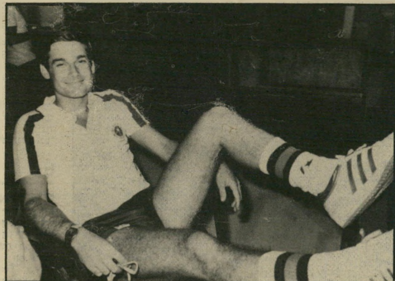
מאמן כדורסל ויינקרץ אחד המועמדים

כלייהתיקשורת עטו בעיקר על מסקנות הרי"ח, המתייחסות למחללי של גרעון הרד, לשלושת הסעיפים העוסקים בהנהלת רשות השידור וחלקה בפרשה. איש לא התייחס,