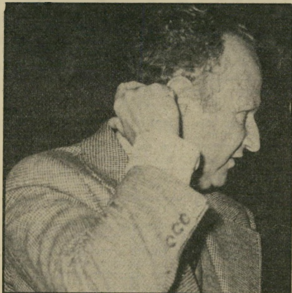
ארקף (מיל') נרקיס ארשת-פנים חמורה