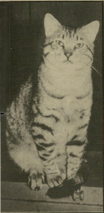
נרדפת מיצי עצומה לראש העירייה

העתק מכתב שנשלח לעיריית תל-אביב וליועץ המשפטי, אך יחד עם זאת אני רוצה לציין שמפליא הד-בר שאגודת אס.א.א. לא הרימה קולה, הרי להם ישנה אפשרות ל-החתמת מחאה בקנה מדה גדול, כ"כ בפנייה לבית משפט מעמדם כאגודה טוב יותר מאשר מעמדו של האורח הבודד. לא מובן לי מה הטעם לנסות ולמצוא בית למספר מצומצם של חתולים וכלבים ולא לנסות למנוע קטל מיותר של אל-פי חתולים. הייתי מצפה שאגודה זו תשמיע קולה.