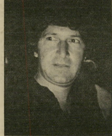
מנהל-קבוצה ז'רז'בסקי שירותים יקרים

קבוצת טוטנהם לא זכתה לנצח את יריי בתה באותו מישחק, הקבוצה האנגלית לוטן טאון, ויצאה ממנו בתיקו, אחרי שהובילה ברוב שלבי המישחק. אך ל-טוטנהם היה זה יום חג, משום שנודע כי אוסולדו ארדילס יחזור לשחק בשורותיה. בשיחה הקצרה עימי הבע ארדילס תיקי וזה להגיע שנית, בבוא היום, לישראל. מראותיה ויופיה של ירושלים הקסימו את הכוכב הארגנטיני. דינה רנן