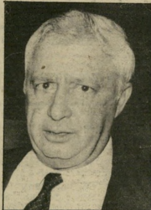
שר-ביטחון שרון גם רצה תינוקות -

...לא רק שרון נתן לפלאג-נות נשק. ציוד וכסף, הוא גם לקח