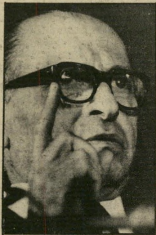
ראש-ממשלה בגין ואזרחים חסרי-תגן

משנסתיימה המלחמה, על הממשלה להורות לצה"ל לעזוב את לבנון - ומיד, כך לא ייפגעו היילנו, ולא נואשם כרוצחים. במקביל לנסיגת צה"ל מלבנון, על ממשלת ישראל לפנות לדעת הקהל בעולם - דרך תינוקות, התיקורת - ולשכנעו לשלוח