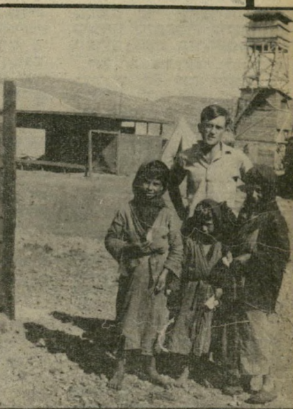
1940: חורש באילון הילד-הנורא