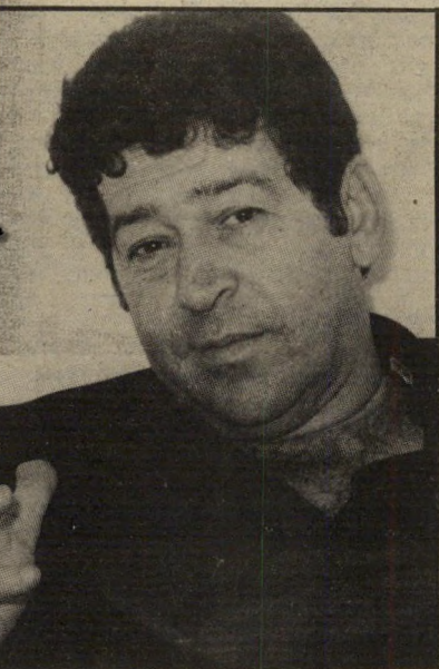
צעירי תמ"י רואים בתת-אלוף בנימין (פואד) בן-אליעזר גנרל מיקצועי שהוצנח אל הצמרת.

היו בנמצא כספים ותקציבים ומירב העידוד והתמיכה. אברחצירא ואוון, שהעניקו לי-חסידיהם ותומכיהם תפקידים ומינויים פוליטיים, שילמו את המס גם לצעירים: ויקי שירן, צעירה יוצאת מצרים ופעילה בולטת בשכונות, נתמנתה כדוברת תמ"י ודוברת מישרד-הקליטה.