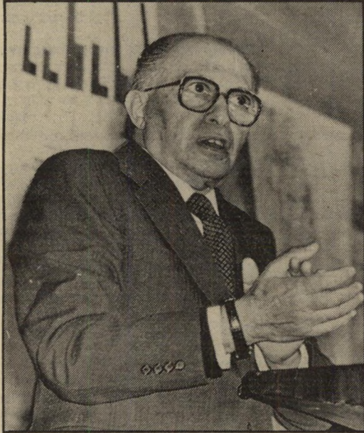
מנחם בגין תמיכה מובנת בג'נוסייד

עונת הסתיו ועצרת האו"ם הקרובה בניו-יורק מעלים שוב את שאלת תמיכתו של מנחם בגין במנהיג חסר רוג', פול פוט, כמייצג הלגיטימי של העם הקמבודי. כידוע, ביצעו מרצחי החסר רוג' רצח המוני של מאות אלפי בני אדם בקמבודיה. אלפי מיטמכים שנחשפו על-ידי המישטר הפרווייטנאמי השולט כיום בבירת קמבודיה,