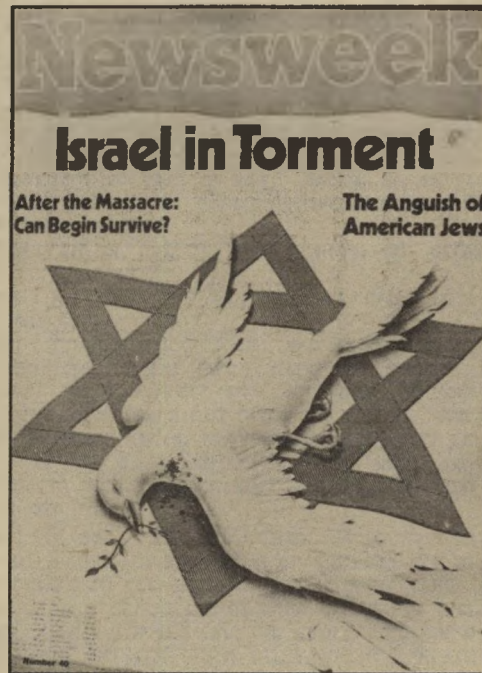
שער „ניו ויק“ 4.10.1982

החלטה המאוחרת והבלתי-יכנה של ממשלת ישראל להעביר את עניין הסבך בבירות לוועדת-חקירה ממלכתית, לא היה בה כדי לטהר את מנחם בגין ואריאל שרון בעיני דעת-הקהל בעולם.