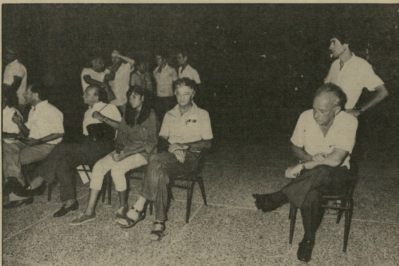
יצחק רבין יושב בודד מאחרי בימת הנואמים בכיכר-מלכי-ישראל. הנואמים המופתעים גילו רק לפני עלייתם לרחבה, שהם לא יישבו על הבימה, אלא מאחריה.

כאשר שמע ראש-הממשלה שבהפגנת ההמונים בכיכר-מלכי-ישראל היו 400 אלף משתתפים, הוא הודיע שלהפ"גנה של הליכוד יבואו חצי מיליון. בינתיים נכנע בגין לתביעה הציבורית הגואה, הודיע על הקמת ועדת-חקירה וביטל את הפגנת-הנגד המיועדת. צלמות-המערכת ענת סרגוסטי וציפי מנשה, הנציחו כמה מן המשתתפים בשלוש ההפגנות שנערכו בסוף השבוע — מאחרי הבימות ולפניהן — שהכניעו את מנחם בגין.