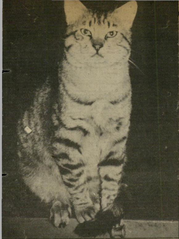
החתול מיצי — בסיכסוך שכנים