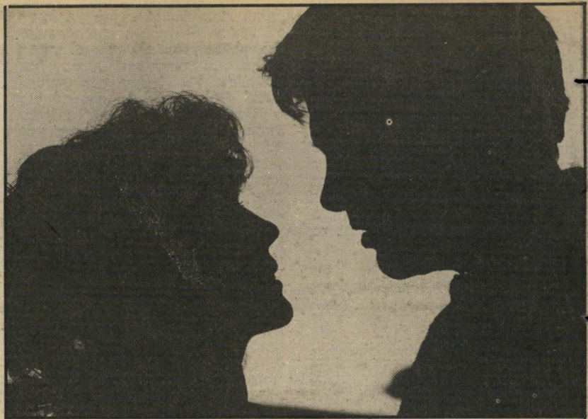
3. האדומים (ארצות-הברית)