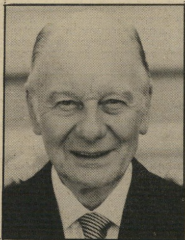
שחקן מי שנה השנה

במיוחד אם יזכה לראות פירות מיוזמתו. במודע. או שלא במודע. גם הקהל המבקר בסרטים ישראליים הושפע מן ה־סרטים המיובאים שראה לאחרונה. לראיה, השנה, בפעם הראשונה, הוא היה מוכן ללכת בהמוניו ולראות סרטים שאינם שייכים לקטיגוריה של בידור דבילי — סרטים כמו נועה בת 17 או צלילה חוזרת. נועה בת 17, שהיה ללא ספק הסרט הישראלי הכולט של השנה, שילוב מוצלח ביותר של דראמה אישית ומשבר חברתי עמוק, שבר בדרכו כמה וכמה מוסכמות מקודשות בשוק הישראלי. קודם-כל הוא הוכיח שכאשר יש לסרט מה לומר, הוא אמר זאת בכל הכנות, הכאב ועומק הנשמה, הוא תמיד ימצא אונן קשבת. חוץ מזה, הסתבר שמיעוט אמצעי-הפקה אינו הייב לפעול בהכרח לרעת הסרט. אם הם מנוצלים נכון. ועוד הסתבר, ששחקנים ישראליים, אפילו כאלה שגוראו מגוחכים למדי בסרטים אחרים, מסוגלים בהחלט לשכנע, אם מדריכים אותם נכון. הסרט היווה פיצוי לבימאי יצחק («צל») ישרון, אחרי שנים ארוכות של מרורים. והצלחתו כבר הובילה לסרט נוסף. שאתו הוא עושה בימים אלה. אייפשו לעבור לסדר היום מבלי להז-