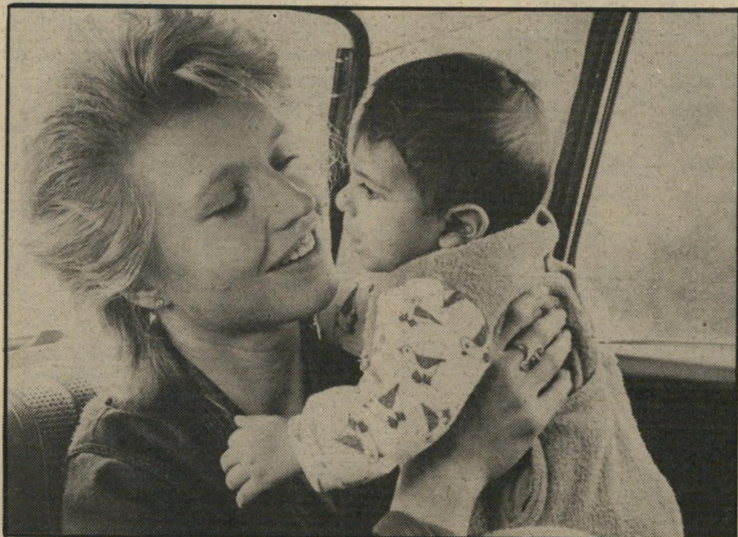
4. במעגל ההונאה (גרמניה)