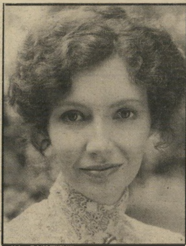
שחקנית מי שנה השנה