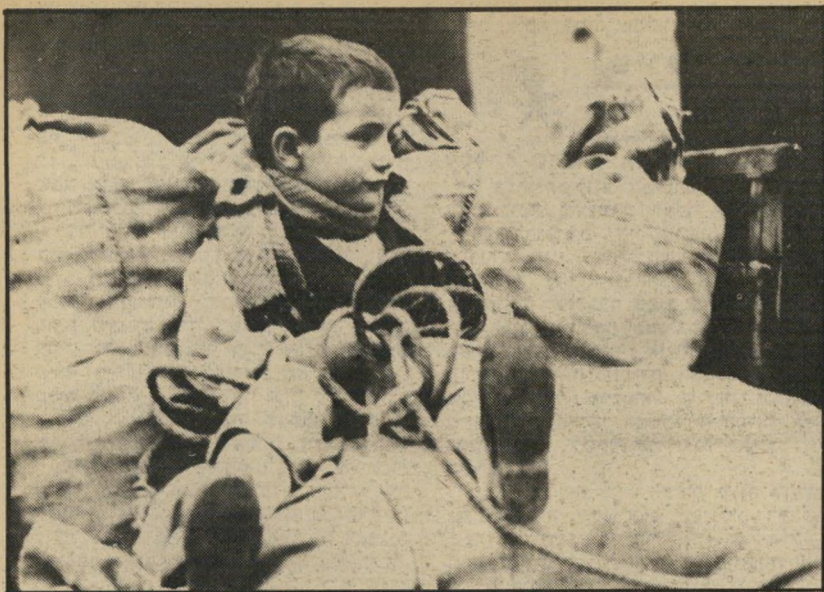
4. קבקבי העץ (איטליה)