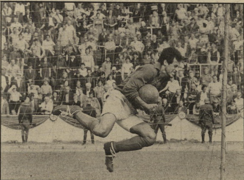
1. הבריחה לניצחון (ארצות-הברית)