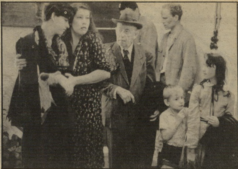
1. הספינה מלאה (שווייץ)