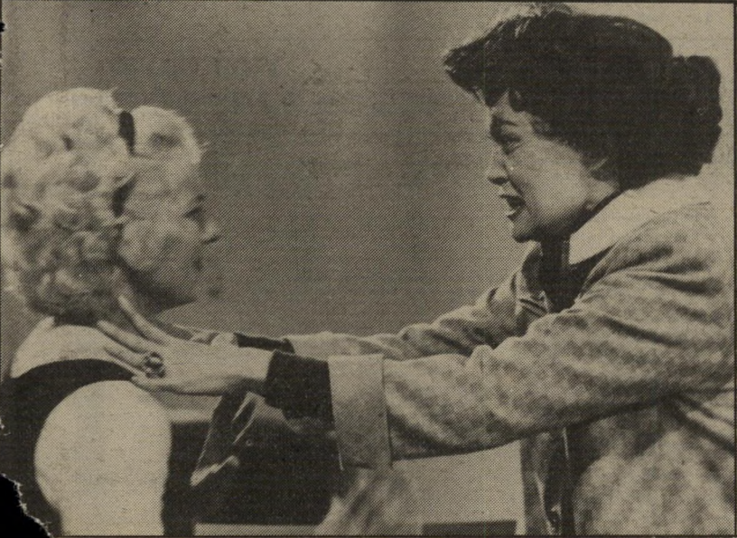
2. אמא יקרה (ארצות-הברית)