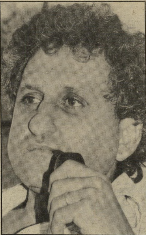
א. ב. יהושע: