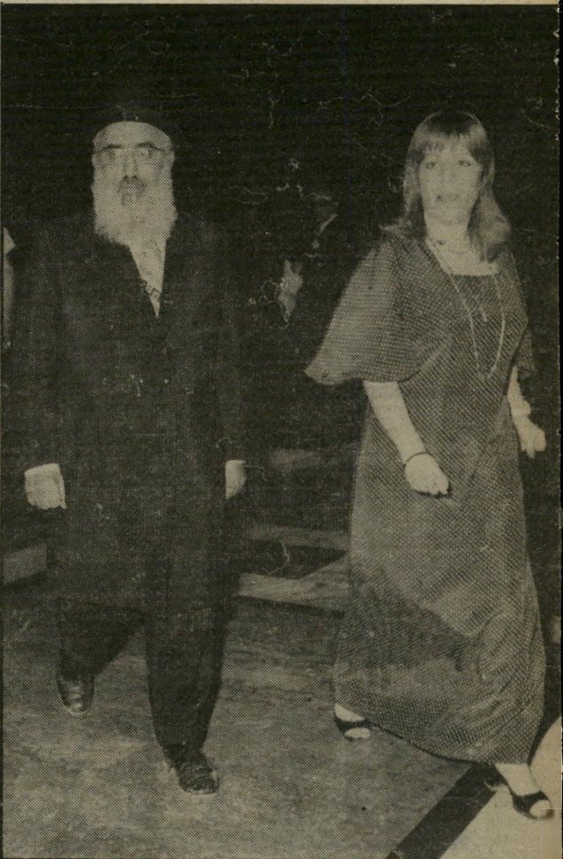
גנני (בהריון) עם הרב גורן ועם יצחק רבין הגעתי לאן שהגעתי בזכות צרוף מיקרים

העבודה והילדים. אני משתדלת שהילדים לא ייפגעו. כשאני באה הביתה, אני רק עם הילדים, ולעצמי אין לי זמן. רק כשהם לא בבית, אני מתפנה לעצמי, ומתי הם לא בבית? הם תמיד בבית.