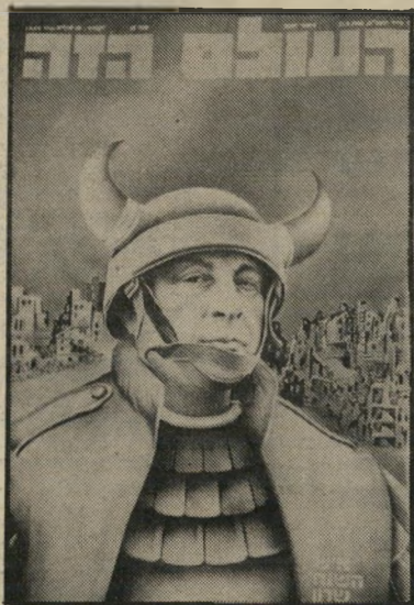
שער איש-השנה וגם ערפאת

יכולנו לבחור ביאסר ערפאת. אך לא ייתה זאת הבחירה הנכונה. אמנם, הצד של "די" במילחמה זו היה חשוב ביותר, אך