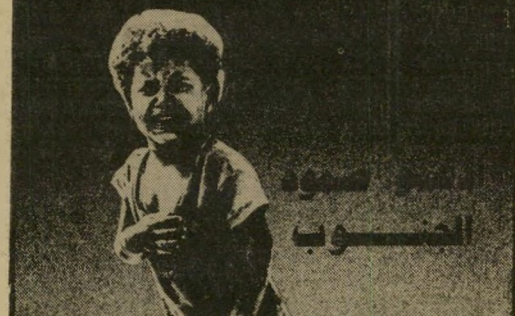
פלאקאט על ג'מבלוט: ילדים בהפצצה

מילחמתנו שה צה"ל היתה שונה לגמרי, והוכחה על-ידי מניעים שונים בתכלית. כל צבא מכין בכל עת תוכניות למיבצעים צבאיים, שהוא עשוי להידרש לבצעם. תוכניות אלה באות לקדם פני בעיות צבאיות משוערות. לנגד עיני המתכננים של צה"ל, שהכינו את תוכניותיהם בלי קשר לבעיות פוליטיות אקטואליות, עמדו הבעיות הצבאיות שהיו קיימות, לפי הערכתם, בלבנון. הם לא האמינו באגדה, שהופצה לאחר מכן במיסגרת מערכת-הכיווץ, כאילו עמדו הסורים והפלסטינים לתקוף את ישראל במיתקפה צבאית גדולה, להשמיד את חיפה, לכבוש את הגליל ושאר דיבריי-הבל מסוג זה. אך היתה להם מקור לדאגה.