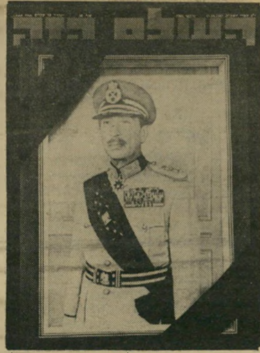
העולם הזה: אנוור אל-סאדאת נרצח על ידי מוסלמים קיצוניים במיצעד בקאהיר. 11.10.81