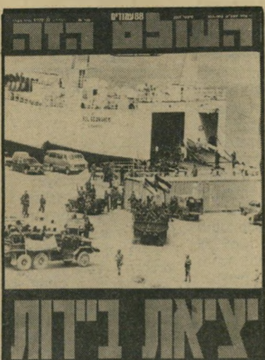
העולם הזה: כוחות אש"ף מתפנים בצורה מסודרת מביירות על נישקם האישי. 25.8.82