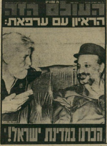
העולם הזה: יאסר ערפאת מעניק ראיון לחברי מערכת "העולם הזה" בבירות הנצורה. 7.7.82