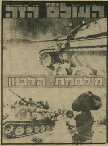
העולם הזה: צה"ל מולש ללבנון, אחרי ההתנקשות בשגריר בלונדון והפגזת הגליל. 9.6.82