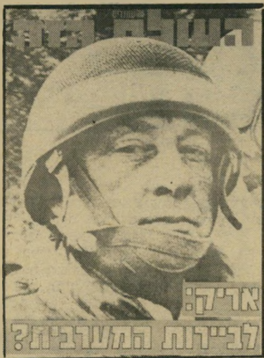
העולם הזה: אריאל שרון רוצה להסתער על מערב ביירות, שבה כותרו כוחות אש"ף. 23.6.82