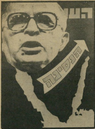
העולם הזה: ישראל נסוגה מסיני, אחרי פינוי היישובים והחרבת העיר ימית. 26.4.82