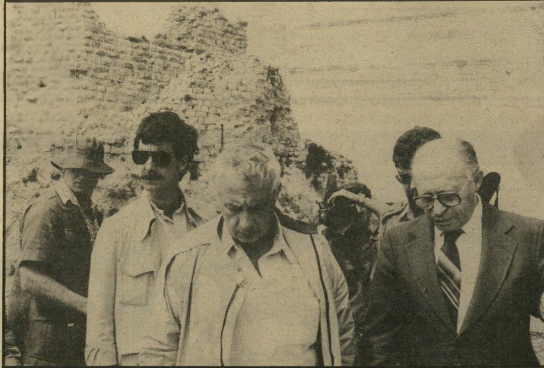
ננחם בגין ואריאל שרון ליד מיבצר הבופור, לפני פירסום אבידות הקרב

שרון נסע לווינגטון שוב ושוב. הוא השיג „הבנה איסטראטגית“, ו"מיזכר הבנה“, אלה „הושעו“ כבר כעבור כמה חודשים, ביגלל משבר חולף ביחסים. הוא דיבר על מרחב-ביטחון ישראלי המשתרע מפאקיסטאן ועד אפריקה אך כל זה היה בעיקרו מסך-עשן. מאחוריו פעל שרון כדי להשיג את הדבר האחר שזיהה חשוב לו: אישור לפלישה הגרולה ללבנון. הדרומית.