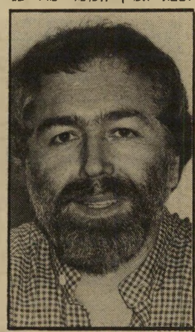
מחזאי סובול סוף אחד

העיתונאי נחום ברי' נע: "תנו לגבר בירה. הוא כליך רוצה. בירת הלבנון קודם, ואחר-כך ירושלים". פנינה רוזנבלום, אחרי הופעה בגני-בנה: "גם להם מגיע שאגיע אליהם. למעשה, אלה הם הבוחרים שלי". מנחם בגין לנשיא ארצות-הברית: "אני חש כי ראש-הממשלה המוסמך להורות לצבא אמין העומד מול פני