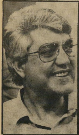
שר לוי מכות קלות

ח"כ הליברלים, בני שליטה: יש לי כבר שני טלפונים בבית. אבל אחד מהם מקוקלל. תמיד, מפני שזה הגר, הג באיור שבו אני מתגורר. ח"כ המערך ירוחם משל: התקנת טלפון שני בבית של ח"כ היא שטות גדול