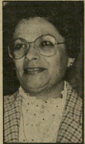
סגנית-שר גדורי-תעסה ערוה מתנדנדת

ראש מועצת גדולי התורה, הרב ש"ך : "אם בגין יכול להעביר בלילה אחד בשלוש קריאות את החוק ש-הוא רוצה - מדוע את כל החוקים הדתיים הוא לא מעביר במהירות כזאת". הסופר יצחק כהנר :