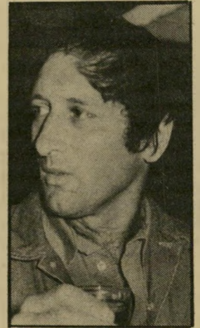
בן דיין שליש מחצי

את נירה לא צריך לחמם. היא כל הזמן בנקודת רתיחה". ח"כ הליברלים , יהודה פרה, על שחזר מיני: "זו חולשה של הגבר: אדם רציני לא יקבל הצעת שכונת". הפירסומאי עמוס טל-שיר : "חאלאס עם דא-לאס".