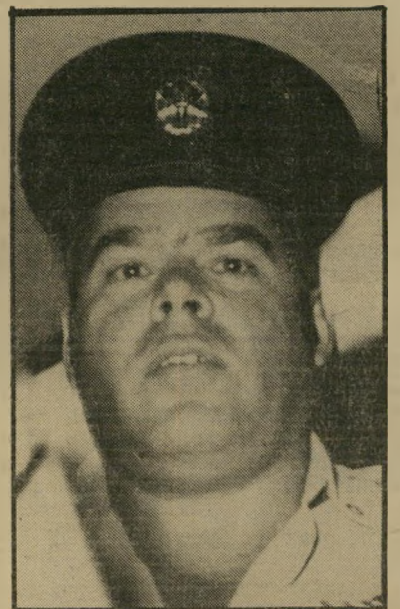
תטי ניציב מרכוס חקירות -

את מי אתם חושבים ראיתי בניו יורק בין היתר? ראיתי את דב נייגר, ניצב מסי-הכנסה, שבא עיף בטיסה מלונדון. ראיתי את ד"ר יצחק טווירי, סגן ניצב מסי-הכנסה, אדריכל החוק החדש למיסוי בתנאי אינפלציה. וראיתי את יוסף לווין, סגן-ניצב מסי-הכנסה לחקירות עד לאתי רונה, ועכשיו ניצב האוצר בניו יורק. מה עושים שלושה מראשי מסי-הכנסה בניו יורק בלתי אם נועדו? והם באמת נועדו. למה הם נועדו לא ברור. מה שכן ברור הוא, ששלושתם נסעו על חשבון האוצר, ואין להם בעיה של הוצאה מוכרת לצורכי מס. מה שעוד ברור, שד"ר טווירי בתנאי באוניברסיטת ניו יורק על מיסוי בתנאי