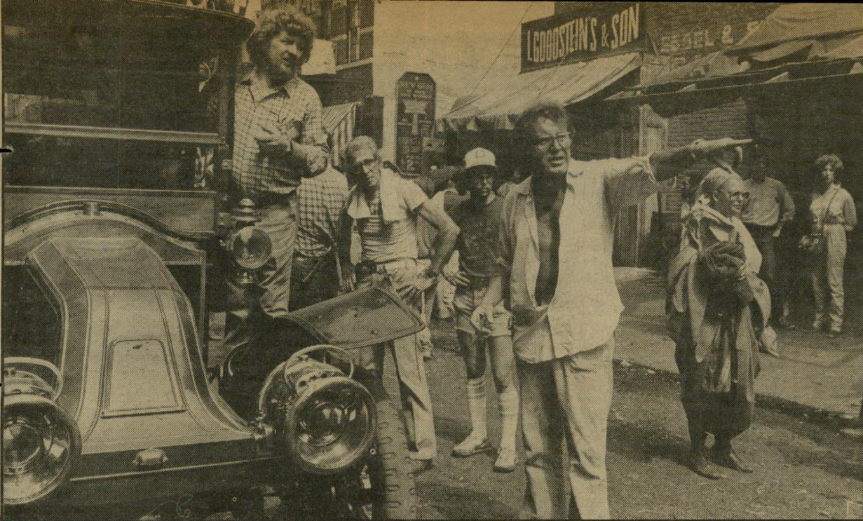
מידוש פורמן (ממושקף) משחזר את תחילת המאה במנהטן (על המבנית — הצלם מירוסלאב אונדריצ'ק) מי אומר שמהגרים מבינים פחות?

גם למקורות המוסמכים אין תשובה אחידה יותר. אמריקה של פוקנר אינה דור מה לזו של ג'ון או'הרה, וזו של סטיינבק שונה מזו של אפדייק. זאת יבשת גדולה, מורכבת ומגוונת, ונדמה כאילו אין אפי שרות לסכם אותה במישפט אחד. בספר אחד או ביצירה אחת.