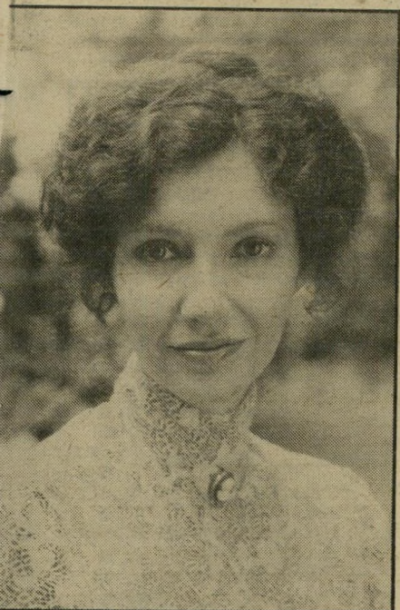
שחקנית מרי סטינברגן הפלדה החזקה

מי זאת אמריקה? האם המישפחה הבורגנית בעיריהשדה, המקדשת בשמר נות על האוכל לפני כל ארוחה, היא היא אמריקה? או אולי הכושים הזועמים הערי מדים על זכויותיהם? ושמה המהגרים הי מגיעים מחוסרי-כל מן הארץ הישנה ופורי צים לעצמם דרך בעולם זר להם? ואולי