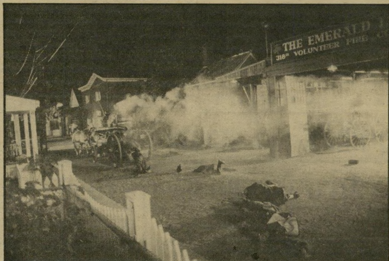
טבח של נקמה במכביה האש המתנדבים גיהנום אליים

הדמויות היו משורטטות בצורה מושלמת כל-כך, שהן ממש קרמו עור וגידים מול העיניים, וכאילו ביקשו להיות יותר מאו תיות כתובות. הבעיה היתה שאיש לא ידע כיצד הופכים ספר כזה לסרט. יש בו דמויות רבות כל-כך, ופרטים חשובים כל-כך קשורים בכל אחת מהן, עד אשר אף סרט