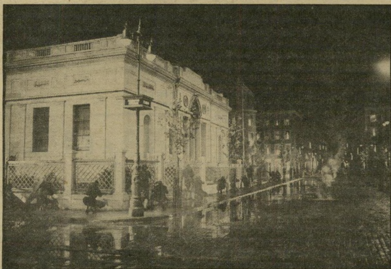
התמצרות ומצור ככניון המזוואון הלאומי ממלכת הבורות האינטלקטואלית