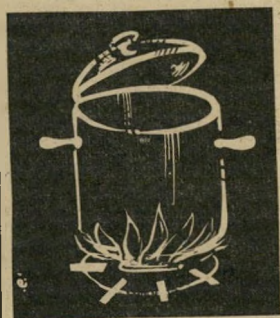
שתי סטודנטיות בנות 23 מחפשות מיכסה לסיר. ת"ד 33559, מיקוד 61344.

* בכל מצב. בחור נאה, 24/166. מעוניין בנשים בכל מצב או גיל ליחסים אינטימיים ת"ד 29208 תל-אביב, מיקוד 61291.