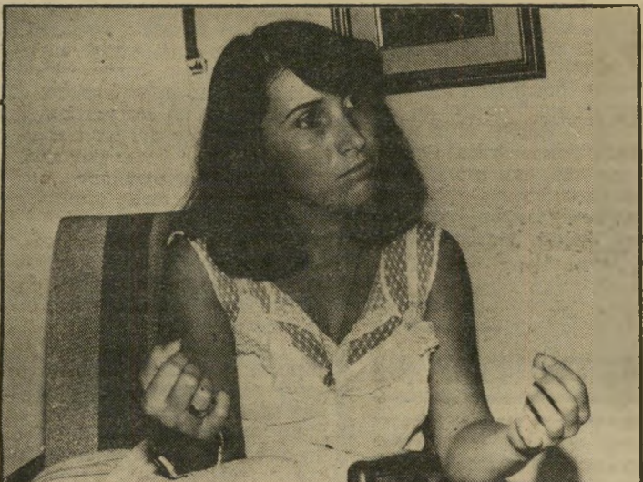
זמרת קונו כמה עולה התהילה?

שאלתי מה עם האולפן והשירים. הוא הביא כמה שירים, אבל רק אחד מהם היה טוב. גם הוא אמר כך. זה היה שיר של עוזי חיטמן. ב"1 ביולי היינו צריכים להיות בקולנוור, ואז הוא אמר שאי אפשר לעשות חזרה כי אין תיזמורת. דחו ל"1 באוגוסט. ב"11 ביולי הוא אמר שרק שיר אחד טוב מאוד - זה של חיטמן. אמרתי לו שאי אפשר לעשות תקליט עם שיר אחד, ואני זקוקה לשירים זמנ"מה לפני ההקלטה. וכי אני לא יודעת טוב עברית. רציתי לבטל הכל וביקשתי את הכסף כי חזרה. הוא לא החזיר את הכסף ו"חזרה.