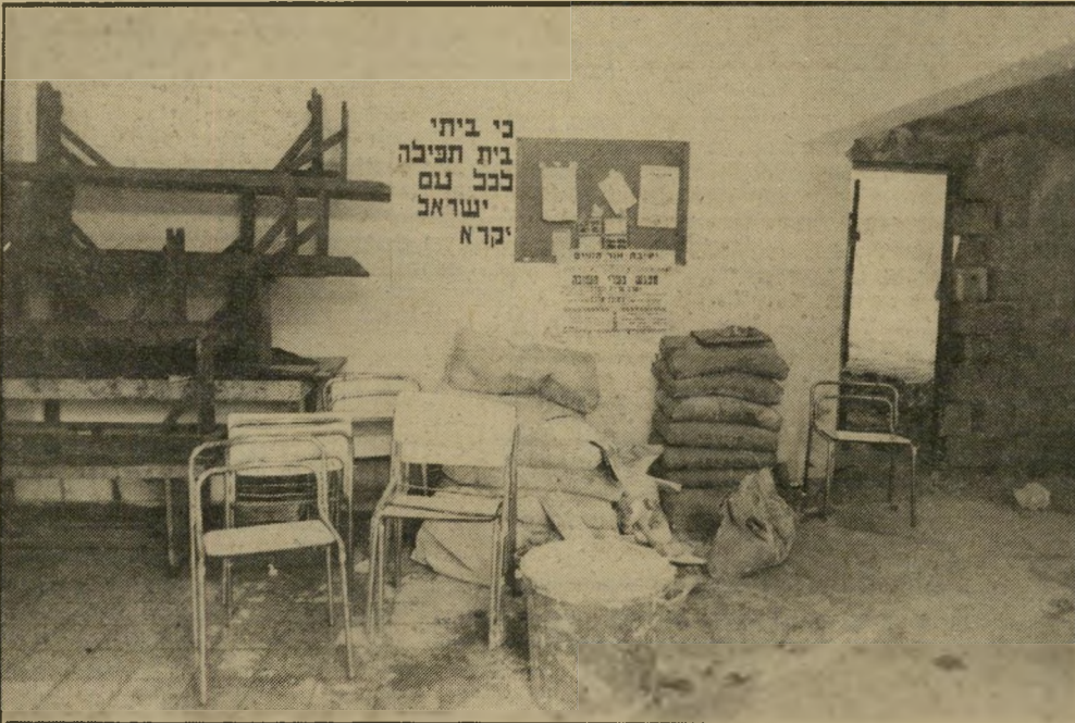
בניית המחיצה בין בתי הכנסת, חלוקה לא הוגנת!