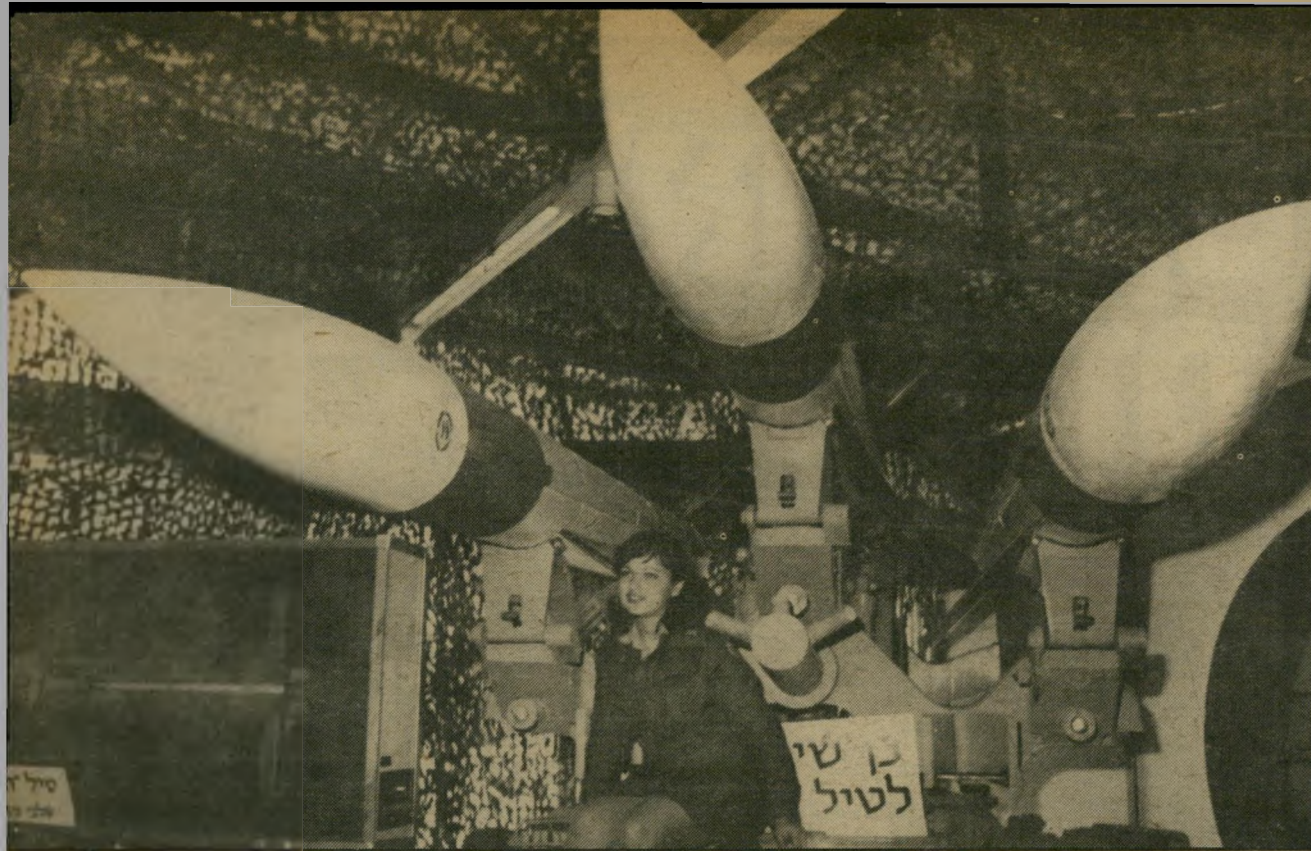
יבוא אמריקאי: טיולי הוק המילחמה הרווחית ביותר