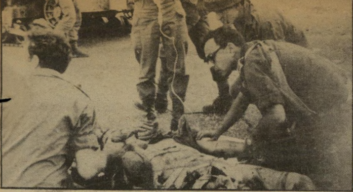
ד"ר פחר ז"ל

אדוני ראש העיר, עם קהל הגז' קקים לגן בלילה, נמנים אנשים מכל שדרות העם. כפי שידוע לך ולאנשיהמישטרה, על פי סט' סטיטיקות מודרניות, 10% מכלל אוכלוסיית הגברים הם בעלי נטיות כאלה. יש לשער, אם כך, שגם בניכם ישנם אנשים כאלה. שבגלל המנטליות השוררת בחברתנו, גא-