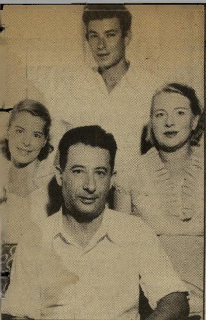
ליבני עם הוריו ואחותו. גידלתי דור של עיתונאים.

מתי פיקדת עז "גלי צה"ל"? אחרי מילחמת ששת הימים ועד אחרי מילחמת יום-הכיפורים. איזו מק תחנה קיבלת לי ידיך ? קטנה מאוד. בסך הכל שידרה התחנה חמש שעות ביום. מתוך אולפן אחד, שגם הקליט, גם שידר וגם ביטל. ביחד עם הסכנאים האזרחים עבדו בגל"צ אולי 20 איש. נוסף לכך היו כמה שריי-לאנס.