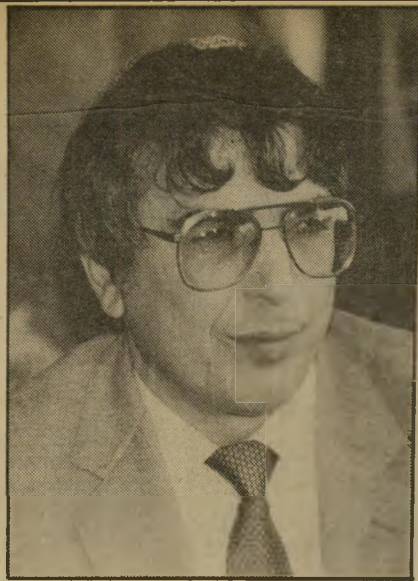
אהרון אביחצירא — ממשכורת של ח"כ ?

במחוז תל-אביב לא הסתפקו ב" הערה זו, וכך נולד אותו חוזר, שהופץ בין כל השוטרים והקצי" נים במחוז.