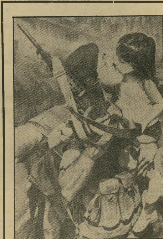
חייל פלסטיני נמרד מבתו בכיורח המינוח השתנה