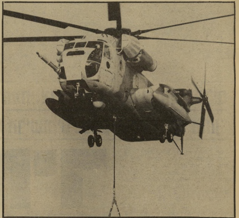
מסוק כבד בפעולה מחיר שעת טיסה: 850 אלף לירות

מיהם מרוויחי המילחמה? אוצר המדינה. באופן פרדוכסלי כמעט, אוצר המדינה הוא אחד מהם. מיפעל הנשק הגדול ביותר בישראל — התעשייה האווירית, הוא מיפעל השייך למדינה. גם מיפעלים גדולים אחרים כמו תע"ש (התעשייה הצבאית) ורפא"ל (הרשות לפיתוח אמצעי לחימה) שייכים למדינה. כך יוצא שחלק מהוצאות מילחמת הלבנון יופיעו דווקא בסעיף ההכנסות בתקציב המדינה. יורם ארידור, שרי האוצר, שכנציג אוזרי ישראל הוא המפסיד הגדול של המילחמה, הוא גם אחד מגדולי המרוויחים. אך טעות היא לחשוב כי החברות הממשלתיות הן המפיקות את כל הרווח. חלק גדול מאוד ממוצרי התעשייה האווירית ותע"ש מיוצרים בחלקם, ולעיתים, ברובם, עליידי קבלני-מישנה מחוץ לי-