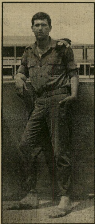
אל"מ גבע נגד רצח בע"מ

תראו לי מדינה נוספת שבה איש-מחדל שכזה נשאר איתן ובוסח על כיסאו. להמצאה החדשנית של מרידור כבר אין זכר בארצנו. הפירסום הכלל-עולמי של ההמ"צאה נדם זה מכבר. גם מצליחן