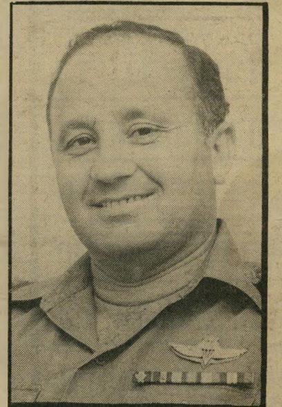
חופי על-פי המיסמכים מונה אלוף (במיל) יצחק חופי לראש ה"מוסד ב"1974, אחרי שחררו מצה"ל.

על-פי מיסמכי הסייאיאי, נתן הביטחון "באיוזרי הגבול ובשטחים הכבושים" בידי שלושה גופים: השיו"בית, מישטר-הגבול והמודיעין הצבאי. השיו"בית הצליח לחדר ל"יסודות ערביים חתרניים", ובכלל זה האים קומוניסטיים וקבוצות ערביות לאר"מניות. נוסף לכך עוסק השיו"בית גם ב"יסודות חתרניים" בשמאל הישראלי. כך, למשל, חדר השיו"בית לתוך תאי המנגנון הקומוניסטי של רק"ח ושל מק"י, וסוכניו