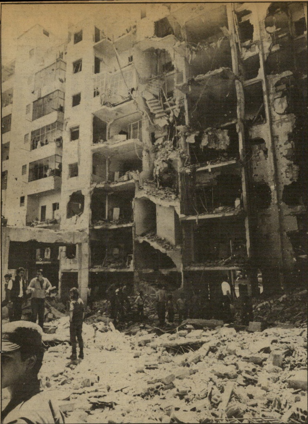
בית המגורים שהופצץ על-ידי חיל-האוויר הישראלי והנמצא בשכונת מגורים נוצרית במזרח העיר בקו הירוק המבדיל בין המזרח למערב. במקום רבות בנפש. בין הפצועים היה התינוק האומלל.

תינוק יש ידיים או לא, כי התינוק סבור משהו כי תינוק שנכונה ואיכך את אביו בהפגזה עדיף על פני תינוק שאיכך את שתי ידייו? מה יותר נורא: ילדה בת 15 ה' נשארת עם תינוק שרוף ובלי בעל, שנהרג בהפגזה, או תינוק שנשא בלי ידיים? אם אמנם חקר משרד הבריאות את הפרשה, כיצד לא שאל את הצלם שצילם את התמונה — צלם ידוע ומוכר, שניתן בקלות לאתר ושכמעט כל הכתבים הצלמים הישראלים השוהים בלבנון מכירים אותו? כיצד לא הגיע אותו צוות חקירה אל הצלם הישראלי חנוך גוסמן, שצילם אותה תמונה? התשובה כנראה מכוערת מאוד: